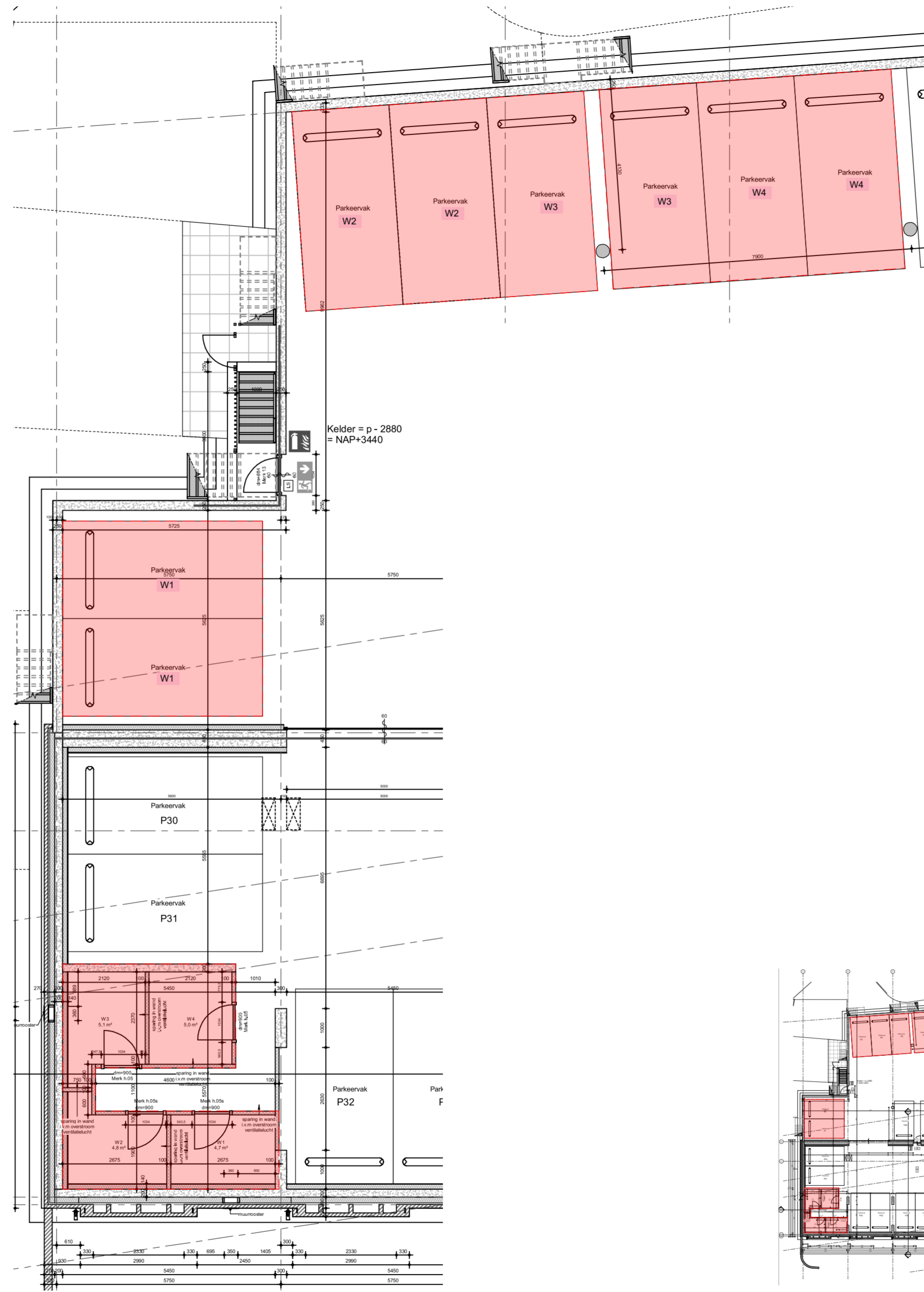
kelder hoogbouw schaal 1a50